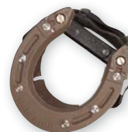
Clog mit Spikes