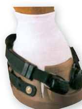
Clog mit Ballenschoner

Auf Wunsch können für den DALLMER CLOG gegen Aufpreis zusätzlich Einlegesohlen (z.B. gegen groben Untergrund oder Schneestellung) erworben werden oder Spikes mit Widia zum Gleitschutz eingesetzt werden. Ein weiterer Zusatzartikel ist der Ballenschoner, der bei Verletzungen, Mauke, etc. den Ballenbereich zusätzlich schützt.