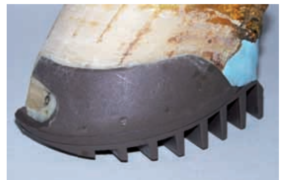
DALLMER Rehe-Cuff mit gewölbter, verschraubter Keilsohle und Sohlenpolster