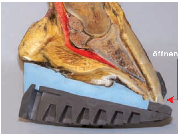
Einleitung der Hufrehe-Behandlung mit DALLMER Rehe-Keil

Um die alte Stellung wiederherzustellen, die Trachtenkeile schrittweise alle vier Wochen um etwa 2 Grad senken, so dass Muskeln und das übrige Weichgewebe Zeit haben, ohne übermäßige Belastung zu heilen. Hierbei ist es dringend erforderlich mit Röntgenbildern zu arbeiten.