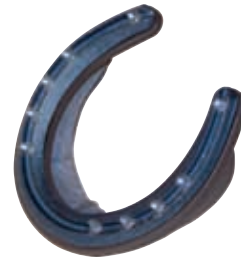
DALLMER Cuff mit verschraubtem Hufeisen

Zusätzlich bietet dieser Hufschuh durch seine breite Kunststoffsohle einen besonderen Sohlenkomfort und eine einzigartige Stoßdämpfung .