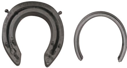
DALLMER Hufschuh mit T-Bügel-Stahleinlage

Wenn das Pferd wieder schmerzfrei ist, die erhöhten Trachten sukzessive erniedrigt wurden und somit die alte Stellung wieder erreicht worden ist, bietet die dynamische Funktion des DALLMER Hufschuhs mit eingelegtem T-Bügel eine überlegene Form der Weiterversorgung. Durch die Beklebung des Hufes mit dem DALLMER Hufschuh erfährt die Hornkapsel eine bessere Ausdehnung und Elastizität als bei dem Beschlag mit je 8 Hufnägeln.